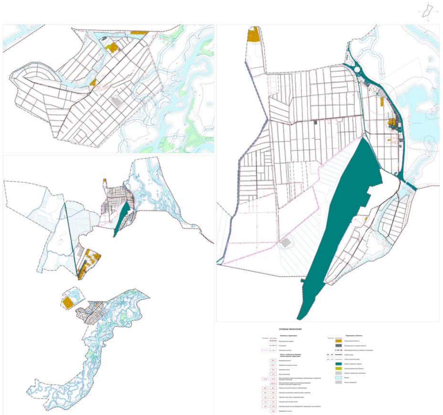
Рис. 2 – Карта зон с особыми условиями использования территории и территорий объектов культурного наследия муниципального образования Калининский сельсовет Усть-Абаканского района Республики Хакасия